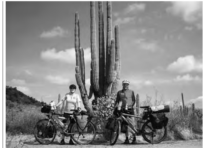
Cardónes - Kandelaberkakteen - sind nicht selten weit verzweigt und über 10 Meter hoch.

Was wir im Vorfeld der Reise über mexikanische Verkehrsverhältnisse gehört haben, klang nicht sehr verlockend. In der Hoffnung, dass es doch nicht so schlimm wird, gingen wir mit einem guten Helm auf dem Kopf an den Start. Sicher ist sicher! Die ersten Tage denken wir noch, dass wir Glück haben, am Sonntag zu starten. Mittler-