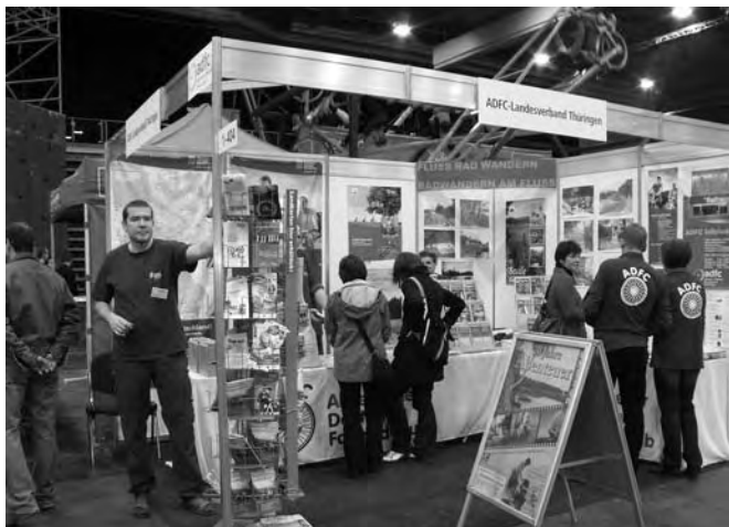
Den diesjährigen Stand des ADFC Thüringen finden Sie in Halle 1 Stand 315

semesse „Reisen & Caravan“ möglich. Wer gerne reist, hat auch Spaß daran, das „Draußen“ zu erleben. Allein in Thüringen verbringen rund 50.000 Sportler (Quelle: LandesSportBund Thüringen e.V.) ihre Freizeit aktiv unter freiem Himmel. Entsprechend groß ist hier das Interesse an neuen, trendigen Aktivitäten. So avanciert die Outdoormesse sport.aktiv zum jährlichen Treffpunkt der Freizeitsportler, die hier ganz gezielt Produkte und Dienstleistungen dieses dynamischen Marktsegments nachfragen und sich dafür begeistern lassen. „Aussteller dieser Branche finden in Mitteldeutschland kaum eine bessere Verkaufspiste“, meint