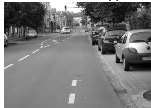
18.-März-Str.: Angebotsstreifen auf der Fahrbahn, allerdings mit Unterbrechung im Kreuzungsbereich für Linksabbieger Autoverkehr

lungen für die künftige Radverkehrsgestaltung abzugeben (z. B. Prioritätenliste für das beschlossene Radwegkonzept, Empfehlungen für die Aufstellung von Radabstellanlagen). Der Radverkehr wird wahrgenommen, ein modernes Konzept von Stadtmobilität hat aber nur wenige Unterstützer, sobald eine Einschränkung der automobilen Freiheiten zu befürchten ist.