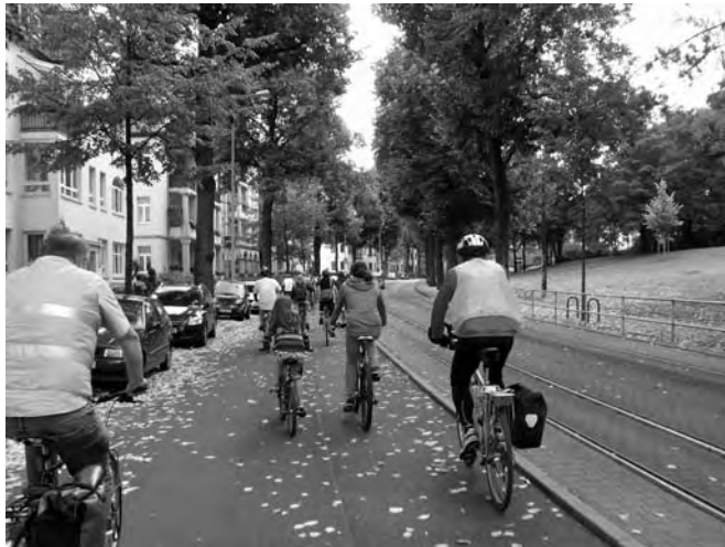
Dem allgemeinen Strom entgegen

Zuerst fuhren wir in den Süden, wo uns natürlich der gesperrte Bahnhofstunnel im Weg war (siehe Seite 7), den wir dann auf der Fahrbahn schiebend hinter uns brachten. Die Windthorststraße entlang als gutes Beispiel einer geöffneten Einbahnstraße kamen wir zum Landtag. Von dort waren stadteinwärts die verschiedenen Sorten von Radverkehrsanlagen zu sehen: baulich getrennter Radweg, Fußweg - Rad frei und schließlich der optimale Radstreifen in der Löberstraße. Die Frage steht im Raum, wann die vorhandenen Planungen zur vollständigen Umgestaltung dieser Strecke verwirklicht werden.