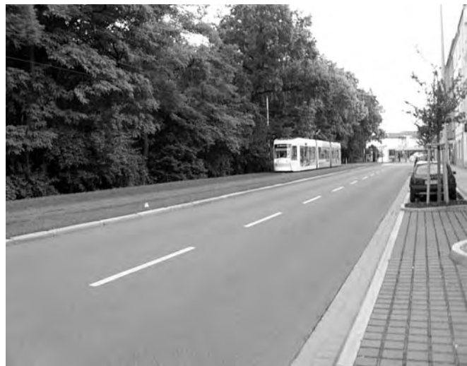
Günstig: Straßenbahn in Seitenlage

Ungünstig ist auch, wenn bei Mischverkehr aller Verkehrsarten auf der Fahrbahn rechts vom Gleisbereich noch Raum von 1 m bis 2 m bleibt. Denn dann gibt es natürlich Straßenbahnfahrer, die überhaupt nicht einsehen, dass die Sicherheit auch eines einzelnen Radfahrers der Geschwindigkeit und der Fahrplaneinhaltung vorzugehen hat. Nach einiger Zeit übrigens sind langsame Verkehrsteilnehmer, wozu auch Radfahrer gehören, verpflichtet, an geeigneten Stellen ein Überholen des sonstigen Verkehrs zu ermöglichen. Wenn man in eine Parkbucht fährt, hat das aber regelmäßig die Konsequenz, dass außer der Bahn noch jede Menge Kraftfahrzeuge überholen. Diese wären auf das Ausweichen gar nicht angewie-