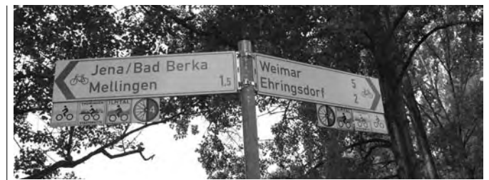
Teilweise ist am Ilmtal-Radweg schon eine vorbildliche Wegweisung anzutreffen

Die Gemengelage ist vielschichtig und noch nicht endgültig geklärt. Sicher ist, dass im Rahmen des Rennsteig-Projektes dem Mountainbiking im Thüringer Wald gro-