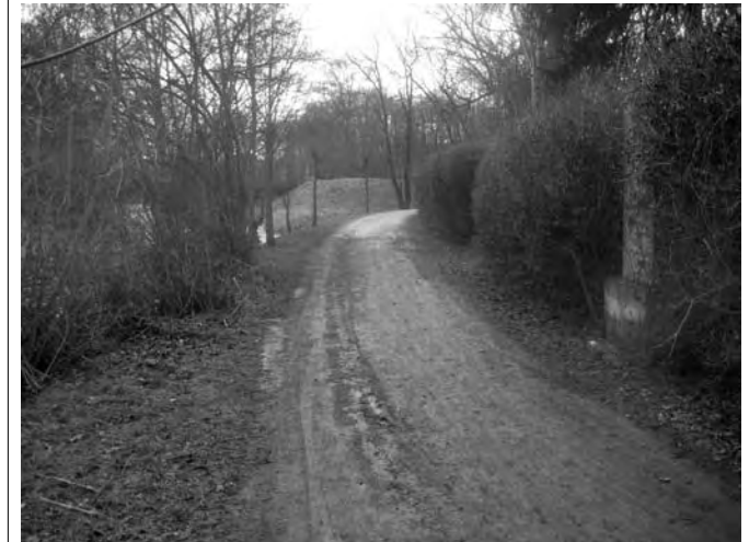
Radwegeführung im Überschwemmungsgebiet – der Ilmtalradweg ist noch nicht überall in Weimar in einem guten Zustand ...