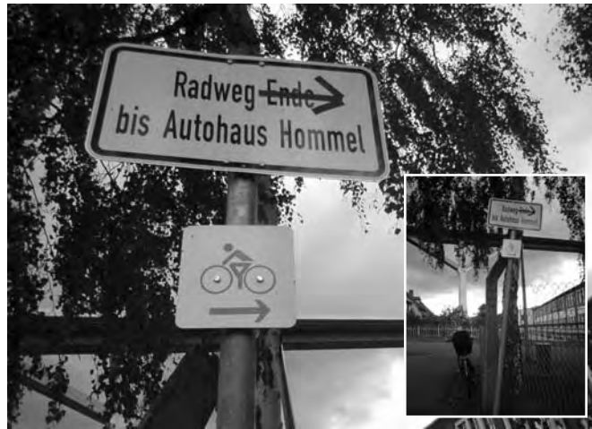
Das Ende vom Ende des Haseltalradweges

Nicht eröffnet und auch nicht neu beschildert wurde allerdings der Radweg-Anschnitt. Trotz aller Be-