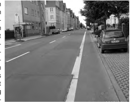
Radfahrstreifen statt Parkstreifen auf Bundesstraße unzulässig?

Absenkungen angebrachten Verkehrsschildern zufrieden und nimmt auch die regelmäßige Sperrung durch wartende Autos in Kauf. Etwas moderner ist die Sanierung der 18.-März-Straße gelungen: hier wurden seitliche Radfahrstreifen eingerichtet, der Radverkehr wird also auf die Straße geführt. Der Streifen setzt jedoch im Bereich der Kreuzung Waltershäuser Straße zu Gunsten einer Linksabbiegespur aus. Diese aus unserer Sicht inkonsequente Lösung wird von der Stadtverwaltung nicht in Frage gestellt. Dem reibungslosen Ablauf des motorisierten Verkehrs wird der Vorrang gegeben.