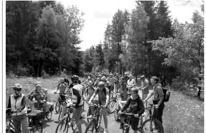
An der Waldhaushöhe (Start am höchsten Punkt zur Abfahrt)

Auf dem Gipfel gab es wieder den ADFC-Bergstempel und Getränke – und von dort aus ging es dann etwa 15 km bergab und eben bis an die Werra, wo der Schlossherr des Breitungers Schlosses, der Rhönclub und der Breitungers Tourismus- und Basilikaveroin mit sehr gutem Catering und lebendiger Geschichte auf die Radler warteten. Dieses herzliche Willkommen im Burghof ist vielen der etwa 200