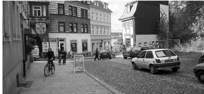
Barfüßerstraße: wegen des schlechten Pflasters kaum nutzbar

Zur Querung der Grimmelallee (Bundesstraße) ist die Nutzung der Fußgängerampel (linksseitig) auf dem freigegebenen Fußweg am vernünftigsten. Trotz neuer Ampel ist es jedesmal ärgerlich,